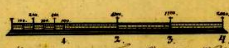
Maasstab von 2000 Faden Fuß ist 4 Wort.

So wie selbige im Jahre 1784 nach der den 10 ten May 1781 ergangenen Königl. Ukase von mir unterzeichneten gemessen und diese Karte angefertigt worden. Koval im Jahr 1788 den 4 ten Januar Heinrich Johann Schramm Kreis-Revier der Kurländischen Kreis.